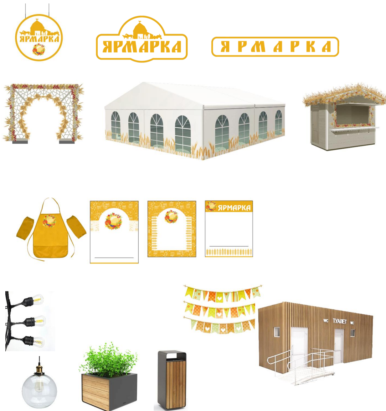
Рис. «Примеры внешнего вида некапитальных сооружений, иных элементов благоустройства и объектов благоустройства мест для продажи товаров (выполнения работ, оказания услуг) на ярмарках, организуемых на территории городского округа Фрязино»

12. Дополнить статьей 47.4 следующего содержания: