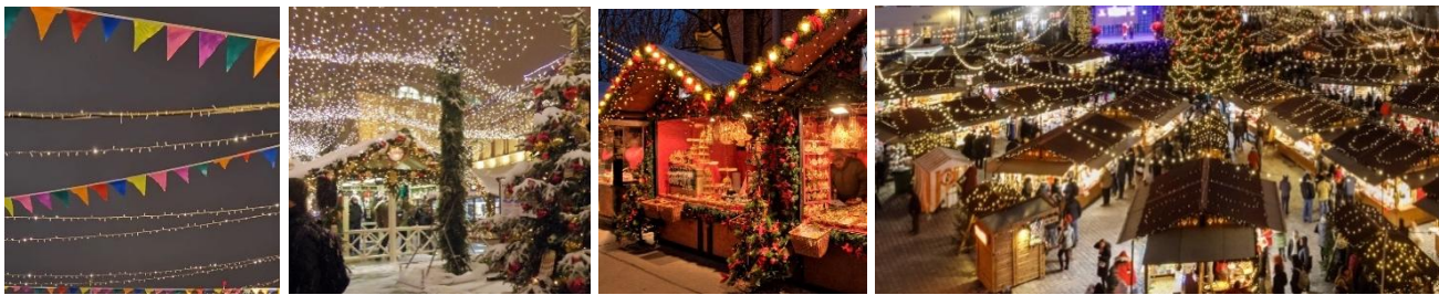
Рис. «Варианты тематического декора»