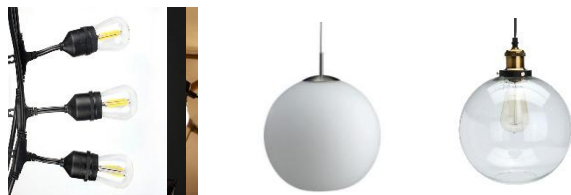
Рис. «Внешний вид объектов (средств) наружного освещения в некапитальных сооружениях»

степень защиты: не менее IP65 тип ИС: LED