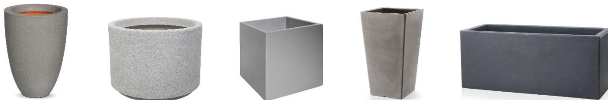
Рис. «Примеры внешнего вида контейнеров для мобильного озеленения»