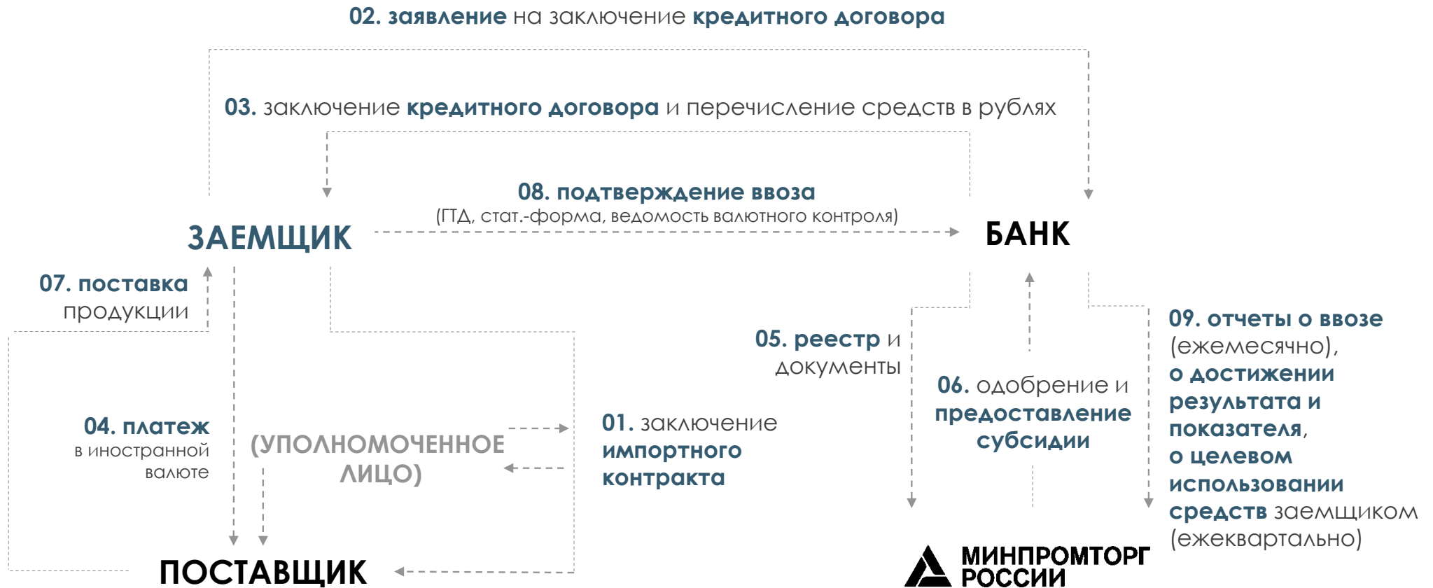
Схема механизма льготного кредитования на приобретение приоритетной для импорта продукции (для заемщика)